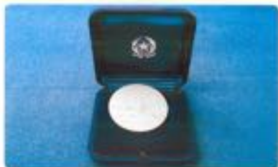
Medaglia d'argento conferita al "Presidente dell'Associazione" per il suo contributo al Paese e alla Puglia.